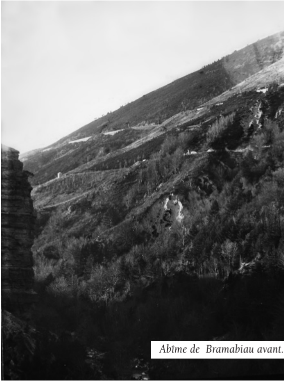
Abîme de Bramabiau avant.

En reconstituant les humus forestiers et en réinstallant les systèmes racinaires puissants des arbres, cette forêt a progressivement joué son rôle attendu de rétention des sols et d'éponge, absorbant l'eau des orages cévenols et la restituant graduellement au réseau hydrologique. Dès 1908, lors de crues historiques sur le Trévezel, les effets du récent reboisement sur la régulation du débit du cours d'eau étaient remarquables : « La population de Trèves est unanime à reconnaître que sans cette circonstance les eaux emportaient le village. En réalité la crue fut assez longue, mais il n'y eut pas de vague balayante et surtout peu de matériaux charriés dans le lit ».