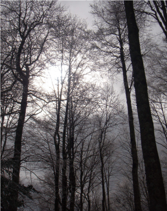
Hêtraie, l'hiver.

planches de coffrage et de charpentes. Les sous-produits résineux sont pour une partie destinés à la fabrication de pâte à papier. Plus récemment, avec la structuration de la filière bois-énergie et les aides publiques associées, plusieurs unités se sont installées dans la région (chaufferies-bois de collectivités, usine de cogénération à Mende), permettant ainsi la valorisation des produits d'éclaircie des plantations les plus récentes sous forme de plaquettes.