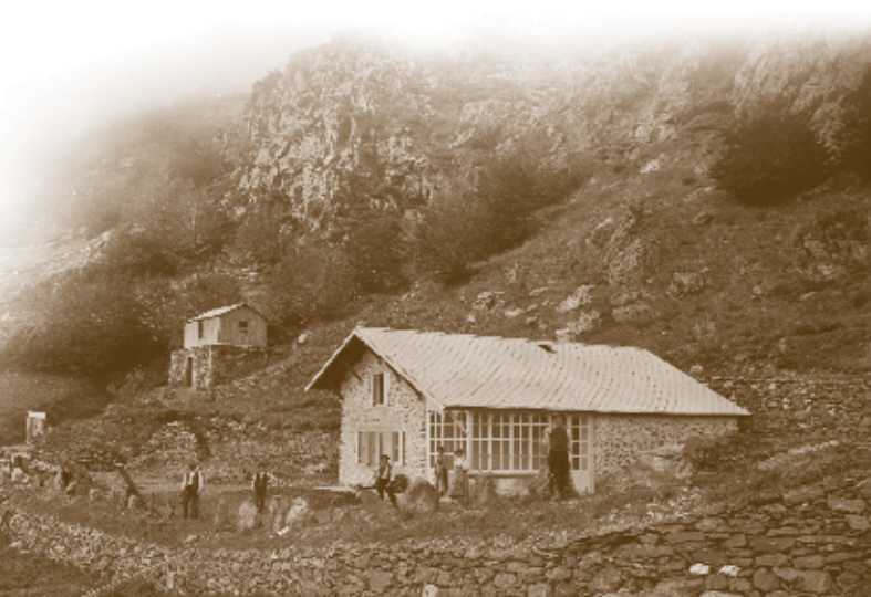
Le chalet laboratoire en 1907