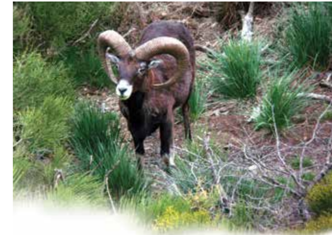
Un mâle adulte, en position typique d'observation, certainement repéré un intrus ou un congénère.

Au détour du sentier vous pourriez être surpris par un sifflement bref et fort, c'est le cri d'alarme du mouflon ! Sa présence peut aussi être trahie au printemps par les bêlements des jeunes, similaires aux cris des agneaux.