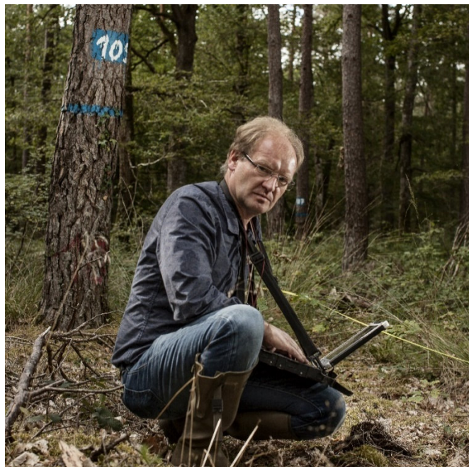
Illustration d'un inventaire floristique réalisé par Yann Dumas, botaniste à l'INRAE.

La première convention de 9 mois ayant abouti à des résultats positifs et valorisables scientifiquement, elle a été prolongée jusqu'à fin 2019 pour aboutir effectivement à la soumission d'un article dans une revue internationale.