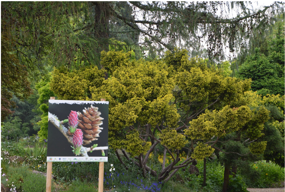
Illustration de l'exposition « Les plantes au rythme des saisons » qui s'est tenue de mars à juin 2018 dans les jardins de l'École du Breuil de Paris.