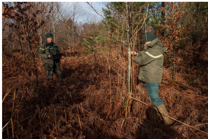
Illustration d'un inventaire dendrométrique sur la placette (PS 61) passée en phase de renouvellement suite aux dégâts des tempêtes de 1999.

La France est précurseur dans la réflexion sur l'adaptation de ce type de réseau au suivi de très long terme, en conséquence des dégâts des tempêtes de 1999 et de l'expérience acquise sur les placettes touchées (qui ont toutes été maintenues jusqu'ici). Néanmoins, d'autres pays apparaissent devoir faire face aux mêmes questions, avec le renouvellement de peuplements déjà arrivés à l'âge de leur récolte finale. Les enjeux soulevés ont suscité l'intérêt du PIC Forêts dans son ensemble. Lors de sa réunion du 13 novembre 2018, le groupe de coordination du programme a donc décidé la création d'un groupe de travail dédié aux questionnements sur l'avenir et la pérennité des divers réseaux constituant le dispositif du PIC Forêts. Sa première tâche est d'identifier les informations à requérir auprès des pays membres sur l'état de l'implémentation du dispositif, afin d'évaluer la portée des défis identifiés et de pouvoir asseoir une réflexion collective à l'échelle internationale.