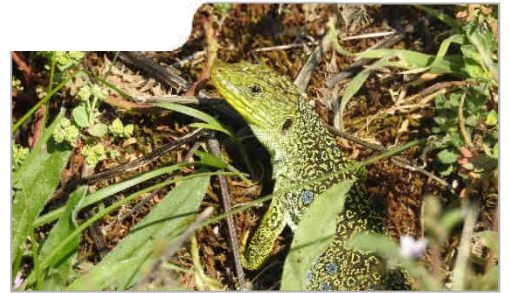
Le lézard ocellé, redécouvert en 2017 dans la région, est une proie facile pour les chiens non surveillés

Les animaux de compagnie peuvent perturber la faune sauvage, notamment pendant la période de reproduction et la saison des naissances. Des constats alarmants de destructions de terriers notamment sur le littoral vendéen invitent à nouveau l'ONF à rappeler quelques règles importantes et pourtant simples à appliquer. Le respect de ces dernières permet à tous de contribuer à la préservation des milieux fragiles que représentent les forêts et les dunes.