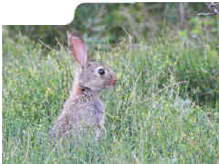
Les terriers des lapins de garenne sont victimes des assauts des chiens sans surveillance

Aussi, ses terriers, une fois abandonnés, sont des refuges importants pour les oiseaux et les reptiles.