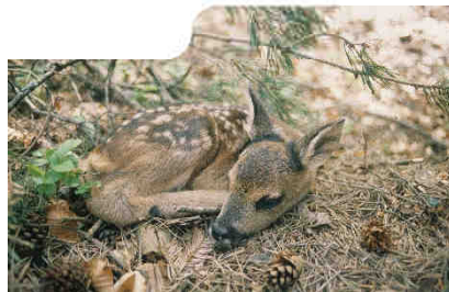
Les nouveaux-nés sont vulnérables face aux chiens sans surveillance