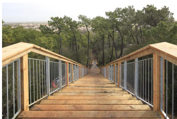
Escalier dans le ciel

Quant au « Pey », il signifie « pic ». Car c'est bien sur le point culminant de la forêt domaniale du Pays de Monts que se dresse le belvédère du Pey de la Blet.