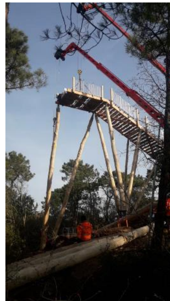
Le nouveau Pey de la Blet – phase travaux