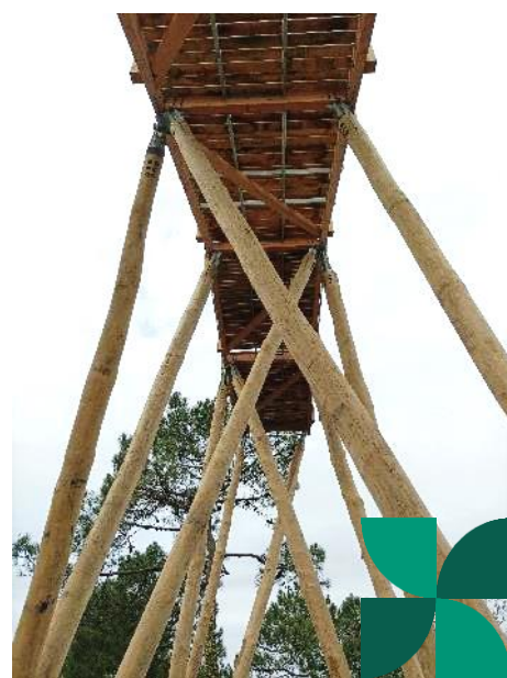
Escalier dans le ciel @ ONF, 0101 et Bois Loisir Création