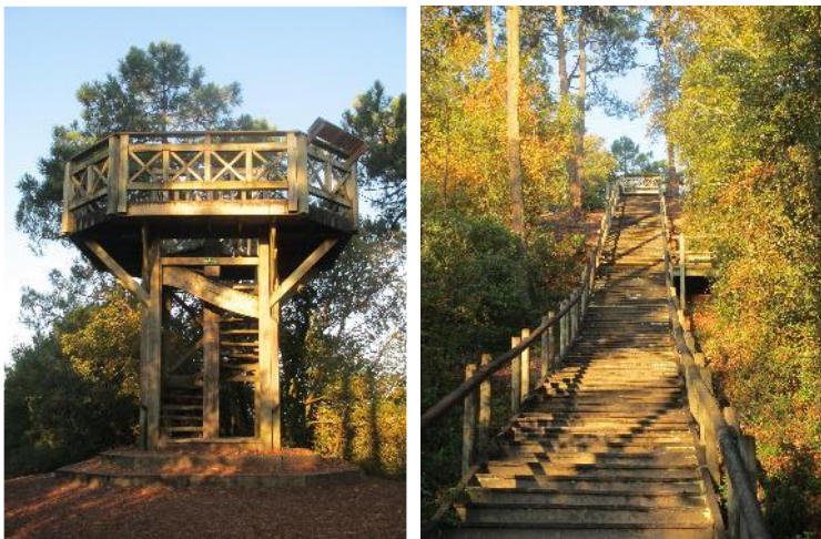
Pey de la Blet de 1996 à 2022

En 1966 : le premier escalier avec des traverses de chemin de fer.