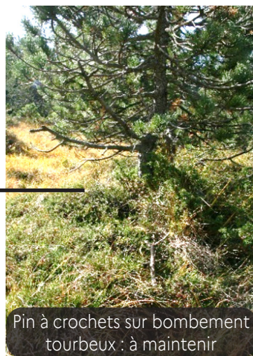
Pin à crochets sur bombement tourbeux : à maintenir

« Gouille » (intérêt patrimonial). Éviter le creusement artificiel d'autres points d'eau