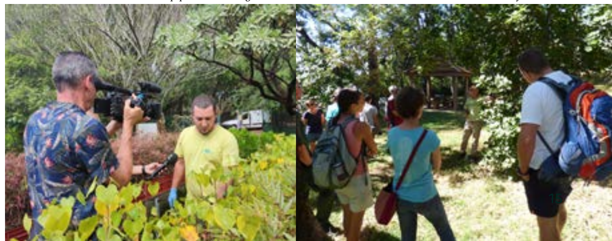
Visite de l'arboretum de La Providence à l'occasion de la fête de la nature