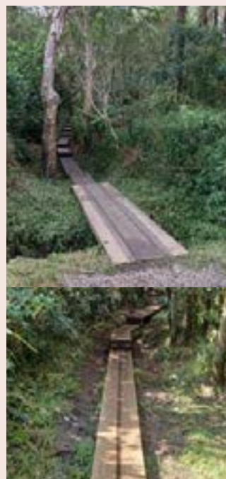
Platelage surélevé sur le sentier de Trou de fer

L'ONF a bénéficié l'année dernière d'une aide financière de l'État d'un montant de 73 000 € , dans le cadre du Plan France Relance , pour moderniser deux de ses pépinières : celle de L'Étang-Salé (essences du littoral et de forêt semi-sèche) et celle des Makes (essences de bois de couleur des hauts). Le but était de renforcer la productivité des pépinières forestières et de fournir des espèces endémiques à l'ensemble de l'île. Les quatre pépinières de l'ONF produisent 57 000 plants par an et pour répondre à une demande croissante (notamment dans le cadre du plan départemental 1 million d'arbres) il était nécessaire d'augmenter la production annuelle à 100 000 plants en cinq ans .