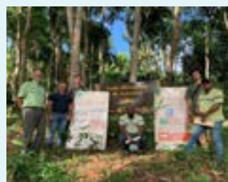
Les équipes d'EDM et de l'ONF en forêt domaniale de Voundzé

tions. Cette composante de la vie de l'établissement s'enrichit aussi sans cesse de nouveaux apports (retours d'expérience, évolution des méthodes, progrès techniques). Pour autant, les métiers de terrain s'exercent souvent dans des conditions difficiles : aléas du climat, progression en milieu accidenté, travaux physiques, pénibilité, etc.