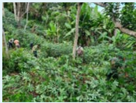
Destruction de cultures illégalement implantées en forêts

De la même manière, 3 ha de cultures détruites en 2021 en forêt domaniale ont été reboisés en 2022 .