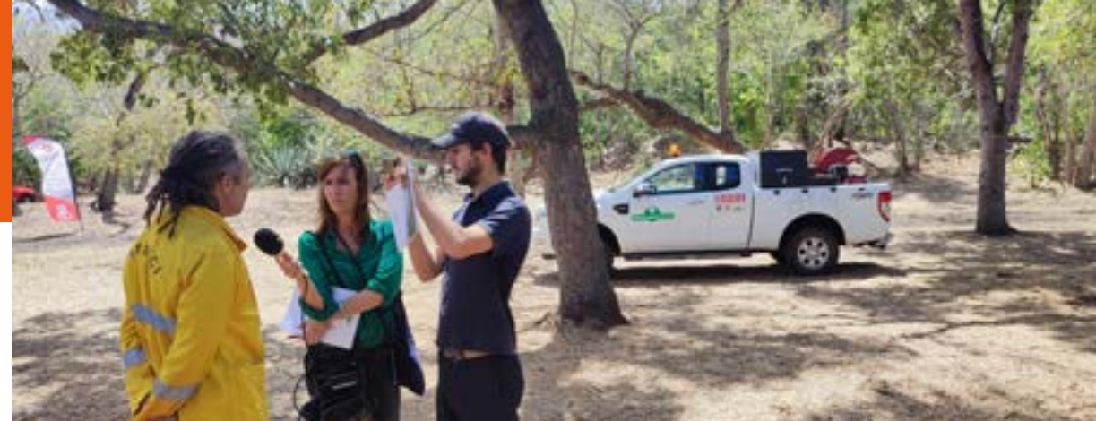
Médiatisation de l'action de sensibilisation sur les risques incendies