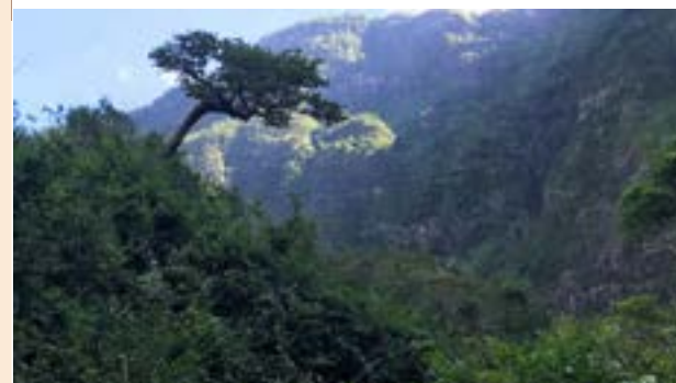
Benjoin surplombant une mer de Liane papillon, qui l'envahira bientôt

La Liane papillon colonise la canopée et empêche la photosynthèse. Durant les prospections, 2819 graines ont été récoltées au pied des semenciers et mises en production. Elles sont destinées à des replantations prévues dès 2023 , en in-situ dans une forêt en reconstitution à Cayenne et en ex-situ dans l'arboretum d'Aurère. Avec les résultats de l'état des lieux des semenciers de Mafate, l'ONF a engagé courant 2022 des actions de déliantage et de badi-geonnage au goudron de Norvège sur 16 individus identifiés comme prioritaires.