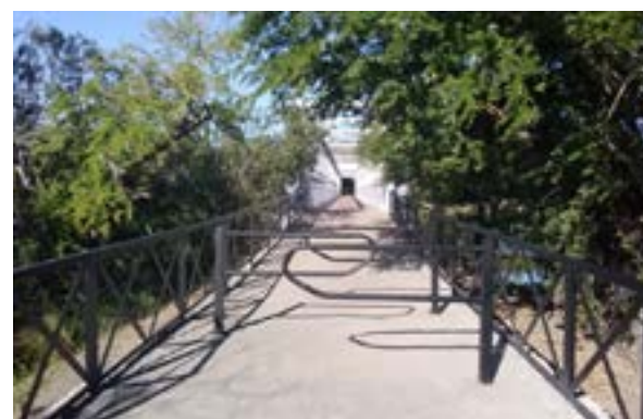
Passerelle accessible à tous