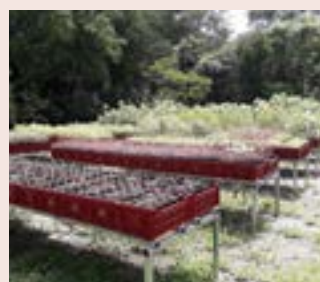
Pépinière de L'Étang-Salé

Cette aide a engendré l'achat de 30 000 godets carrés anti-chignon évitant un enroulement des racines, de 3000 caisses pour optimiser le conditionnement et le transport, ainsi que la construction de clayettes permettant aux ouvriers de travailler à hauteur d'homme.