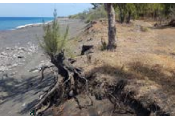
Littoral de Cambaie avant travaux

Toutes ces opérations ont été suivies de près (profil topographique de la plage, recolonisation du milieu par les espèces endémiques ou indigènes) pour permettre les retours d'expériences et partager les résultats obtenus.