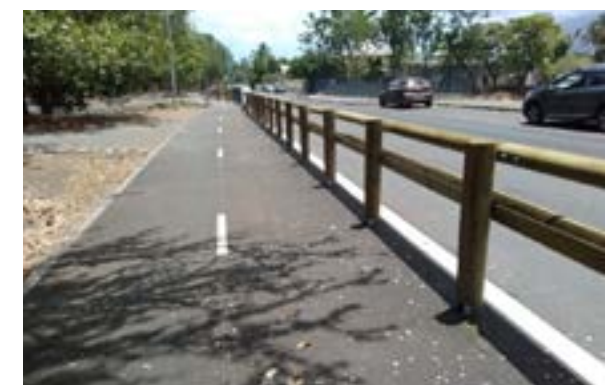
Voie partagée vélos/piétons

L'objectif d' améliorer le cadre de vie des citoyens tout en préservant cet espace naturel sensible en partie en réserve naturelle nationale de l'Étang de Saint-Paul est atteint, comme le montre le doublement de la fréquentation cycliste avant et après travaux.