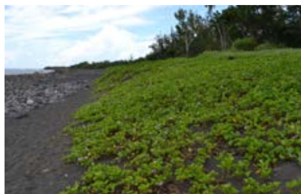
Littoral de Cambaie après travaux