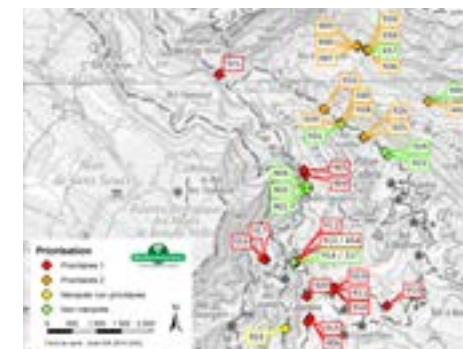
Cartographie des Benjoins prioritaires aux actions de déliantage et de pose de goudron