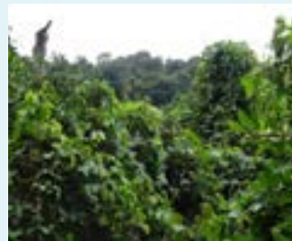
Canopée envahie par des lianes

La totalité des travaux est financée par EDM pour un montant d'environ 375 k€.