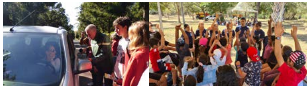
Action de sensibilisation à la problématique des déchets avec le CDJ