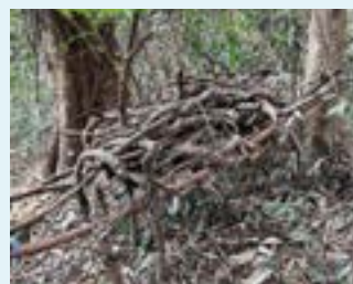
Mise hors sol des tronçons de lianes pour éviter la multiplication végétative