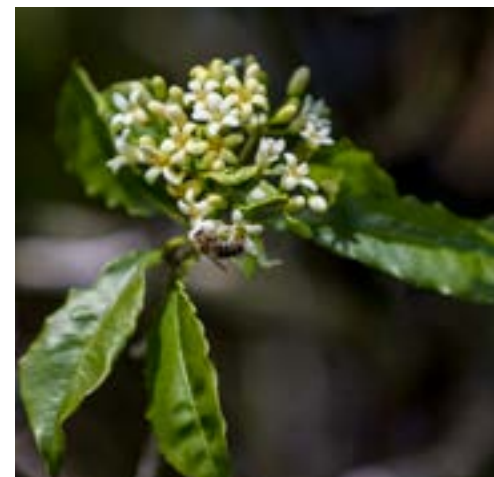
Abeille sur un Bois de joli cœur

Les travaux réalisés sont cofinancés par le Fonds Européen Agricole pour le Développement Rural – FEADER – et le Fonds Social Européen – FSE – avec le soutien financier du Département et de l'État.